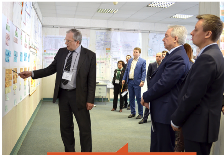
Презентация проекта сотрудниками Воронежского механического завода

Окончательное решение по конфигурации производства ЖРД в г. Воронеже будет принято после рассмотрения в Роскосмосе проектов стратегических преобразований всех двигателестроительных предприятий, вошедших в проект «Ракетные двигатели». Тогда же будут определены окончательный порядок и сроки создания нового объединённого производства ЖРД в г. Воронеже. В предложенном нами проекте это 2016 – 2020 годы. Говорить о каких-либо структурных преобразованиях и кадровых перестановках на заводе пока рано.