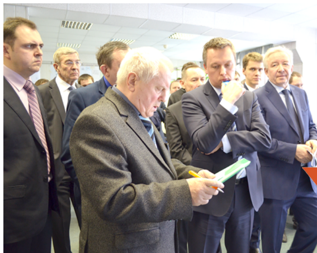
Обсуждение предлагаемых вариантов создания серийного завода по изготовлению ЖРД

рийного завода, имеющего более чем 55-летний опыт освоения и серийного производства ЖРД; - все цехи производства ЖРД располагаются в одном корпусе «под одной крышей», при этом обеспечиваются минимальные транспортировки при изготовлении; - отсутствие капитальных вложений на новое строительство. - минимальное время и затраты на перемещение оборудования и перехода к объединённому предприятию из всех предложенных вариантов; - на территории, которая представлена на планировке ВМЗ, изготавливается 85% серийной продукции ЖРД (8Д49, 8Д411К/412К, 164, 181М, 14Д24, камера сгорания РД191, узлы автоматики двигателя 14Д23), на территории