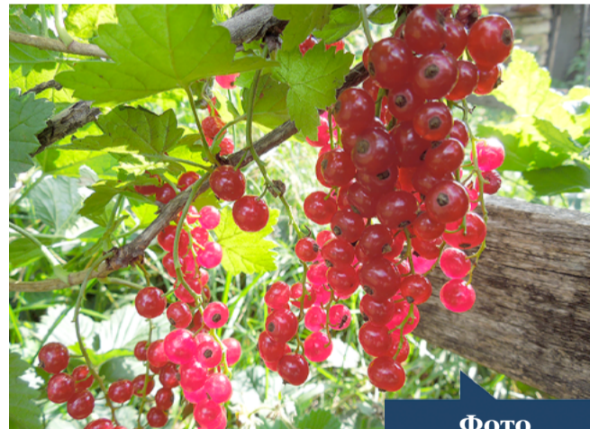
Фото Александра Баленко (цех 35)