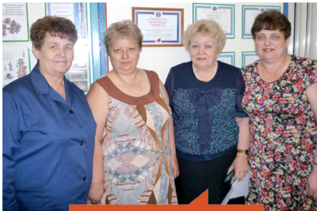
Ветераны цеха 35