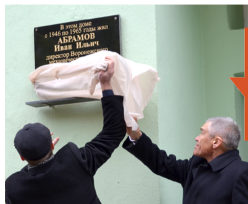
Открытие мемориальной доски